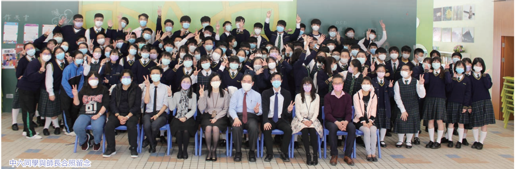
中六同學與師長合照留念