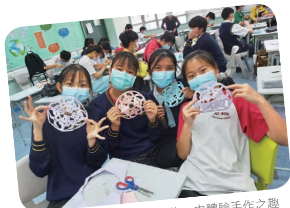
在「中國傳統文化手作攤位」中體驗手作之趣