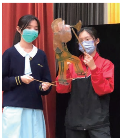
「粵劇及偶影互動示範演出暨展覽」中學習表演技巧