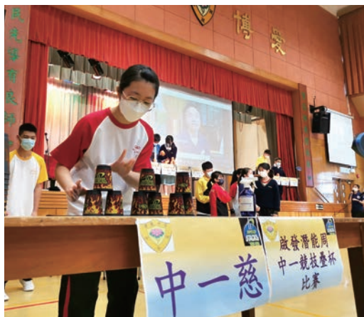
同學全神貫注地參與「競技疊杯比賽」

為啟發潛能，讓同學在不同領域和層面中呈現具能力、富創意、有自信的一面，於4月19至23日，本校舉行了「啟發潛能周」，參與科組包括：歷史科、家政科、視覺藝術科，以及訓導組、輔導組、弘法事務組、德育及公民教育組、課外活動組、健康生活組、社會服務組、升學及就業輔導組、圖書館、家長教師會等。為期五天的活動琳琅滿目，同學能通過攤位遊戲、比賽、表演、展覽等，進一步了解自己的優點和長處。不少同學表現積極投入，氣氛熱鬧非常。願同學皆能從中認識自我，肯定自己，盡展所長！