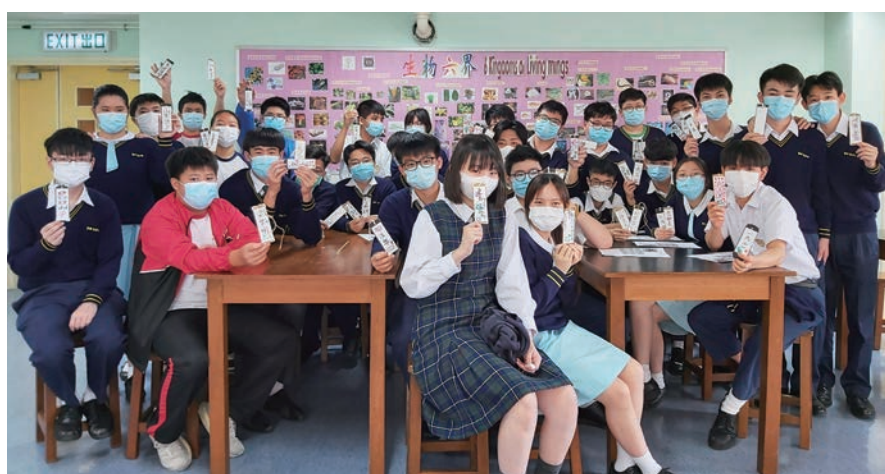
中四級同學在「中國傳統文化手作攤位」中製作書籤