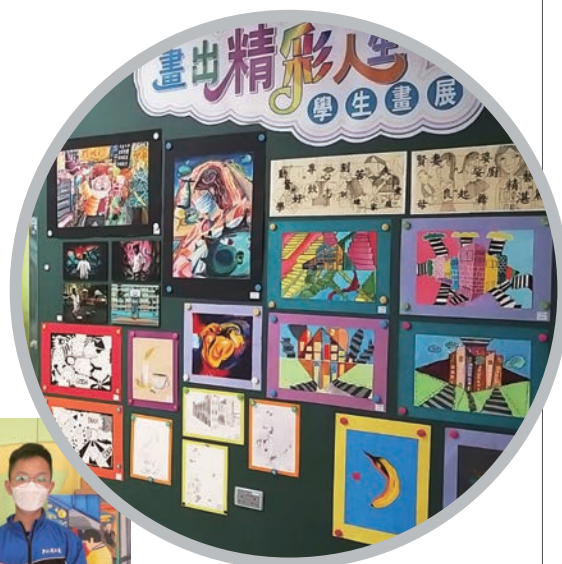
「畫出精彩人生學生畫展」 盡展同學藝術天賦