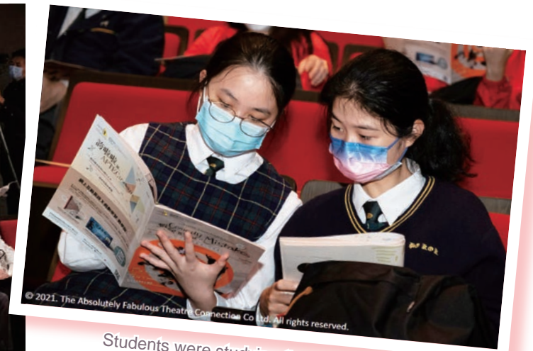
Students were studying the background of the show.