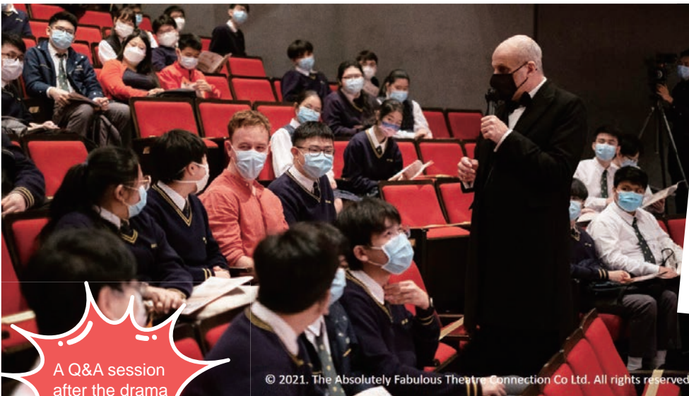
A Q&A session after the drama show.