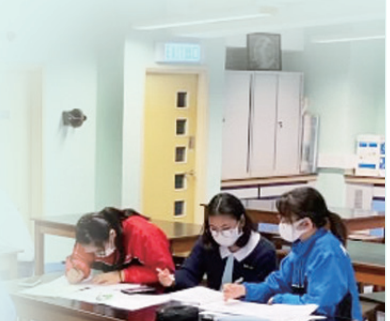
課堂上，同學正嘗試實踐自主學習。