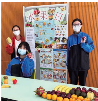
同學悉心準備「水果日」攤位遊戲

為啟發潛能，讓同學在不同領域和層面中呈現具能力、富創意、有自信的一面，於4月19至23日，本校舉行了「啟發潛能周」，參與科組包括：歷史科、家政科、視覺藝術科，以及訓導組、輔導組、弘法事務組、德育及公民教育組、課外活動組、健康生活組、社會服務組、升學及就業輔導組、圖書館、家長教師會等。為期五天的活動琳琅滿目，同學能通過攤位遊戲、比賽、表演、展覽等，進一步了解自己的優點和長處。不少同學表現積極投入，氣氛熱鬧非常。願同學皆能從中認識自我，肯定自己，盡展所長！