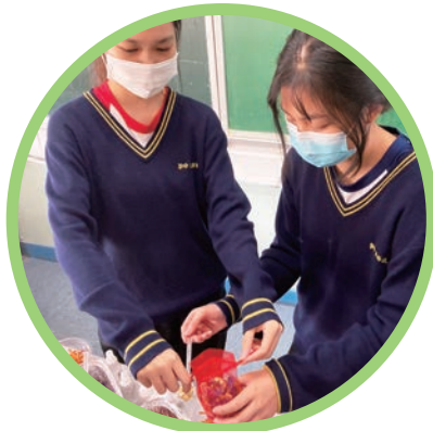
同學投入參與「愛心香包製作」活動，贈予長者，盡顯愛心。