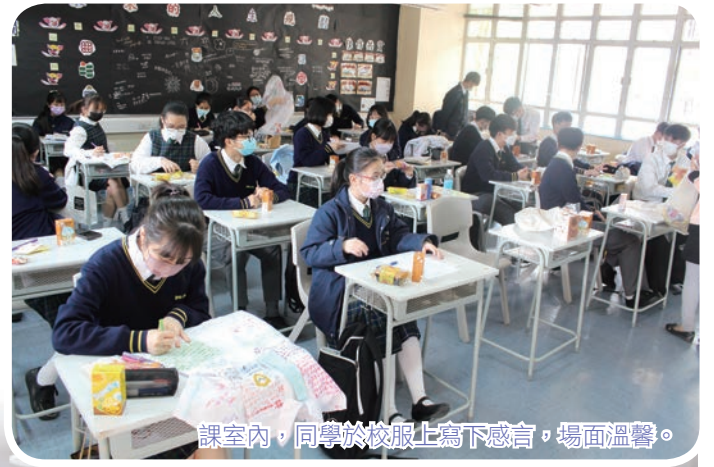
課室內，同學於校服上寫下感言，場面溫馨。

時光荏苒，轉眼又到應屆畢業生離別之時。為歡送中六同學，於本年3月26日的全方位學習時段，校方籌備了「中六惜別會」，讓師生聚首一堂，一訴心底之情。當天，同學先在課室觀賞校友會打氣和宣傳片段；及後，同學收到校友會準備的手作曲奇餅，內有校長和老師的心意咭留念；隨後，師長和學生一同到地下HoME Centre，由各班學生代表分享惜別感言，同學亦用心聆聽校長教誨；最後，師生一同拍攝大合照，留下美好回憶。臨別依依，願同學銘記師長勉勵的話語，積極面對公開考試。在此謹祝中六同學考試成功，前程錦繡！