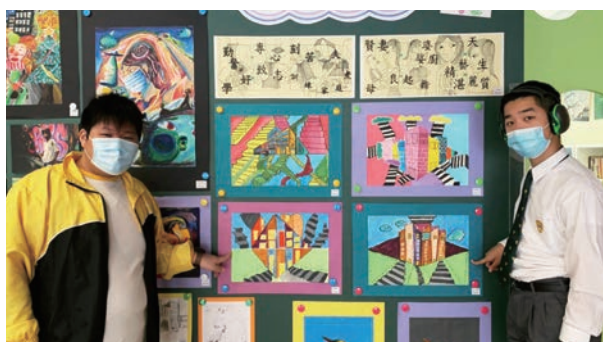
同學展示個人佳作，倍感自信。