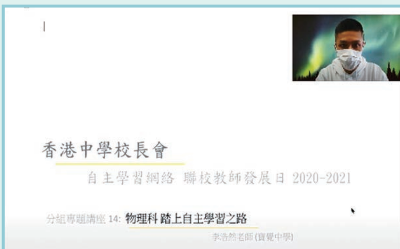
李博士在香港中學校長會的聯校教師發展日中進行專題講座分享

當然，這些評估全部來自自我個人的觀察，不排除因為主觀意願而影響了觀察結果。為了得到較客觀的數據，期終將會利用學生考試成績，和過往數屆學生成績比較，以判斷實踐自主學習是否真的能有效提升物理科的學習，希望到時有機會再和大家分享。