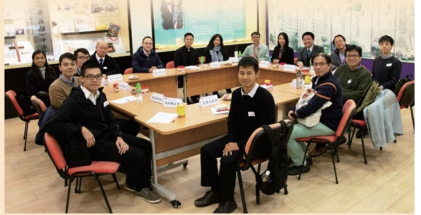
吳老師(左二)與友校校長和教師合照

在完成分享會後，此計劃彷彿已劃上句號，但事實上，此計劃展現的教研精神，深信已植根於各同工心中！在日後的教學路上，大家仍會勇於嘗試不同教學方式，讓學生能更有效地學習！