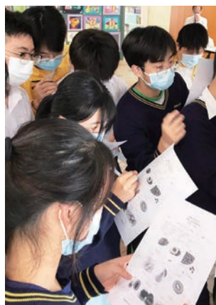
同學投入「水果日」活動