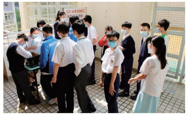
同學積極參與世界閱讀日活動

聯合國教科文組織將4月23日定為「世界閱讀日」，我校圖書館在當日舉辦有獎問答遊戲及好書介紹短片欣賞，向同學推廣閱讀的樂趣，鼓勵大家多讀書、讀好書。