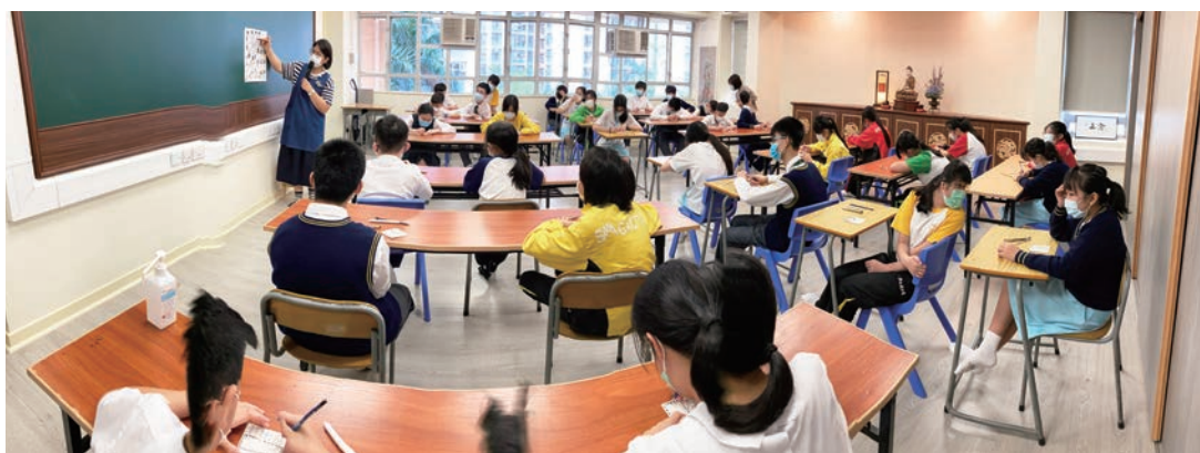
同學在禪修室專注完成「禪繞畫活動」